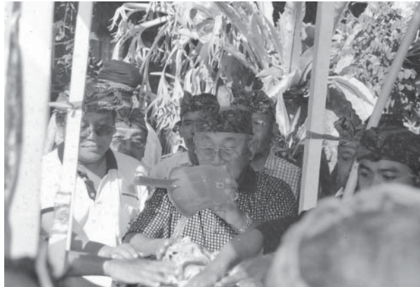
Abb. 2: Das rituelle Waschen einer Verstorbenen in Sanur, Bali 2004

Deshalb werden Verstorbene offiziell rituell nicht betreut – im Unterschied z. B. zum Islam und Hinduismus. Im Christentum finden z. B. keine vorgeschriebenen rituellen Waschungen eines Leichnams durch Familienangehörige oder Pfarrer/Priester statt. 38